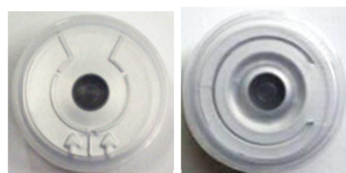
A P M T フリップ M T