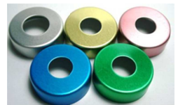
アルミ色も変更可能